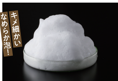
キメ細かい なめらかな泡!

空気をたっぷり含んだフワフワの軽い泡というよりは、キメ細かいなめらかな泡が立ちました