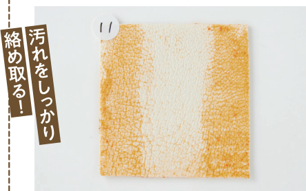
汚れをしっかりと 絡め取る!!