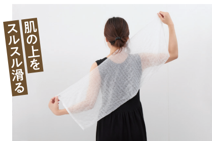
肌の上を スルスル滑る

ボディタオルに泡の薄膜が張った感じで、肌の上をスルスルとなめらかに滑りました。やや幅広なので背面も洗いやすそうです